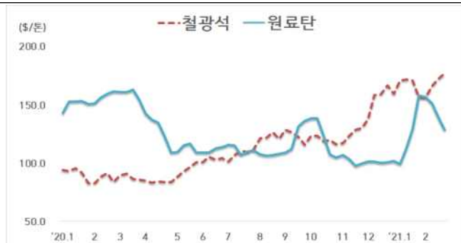
< 철광석/원료탄 가격 동향 >