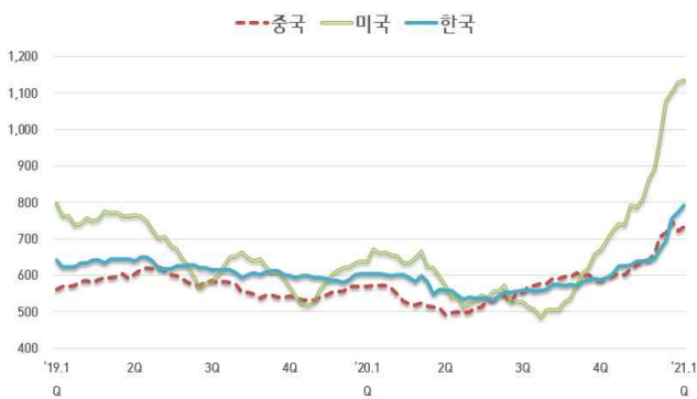
【국내외 열연강판 내수가격 동향】