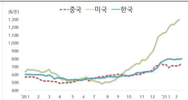
< 국내외 열연강판 내수가격 동향 >