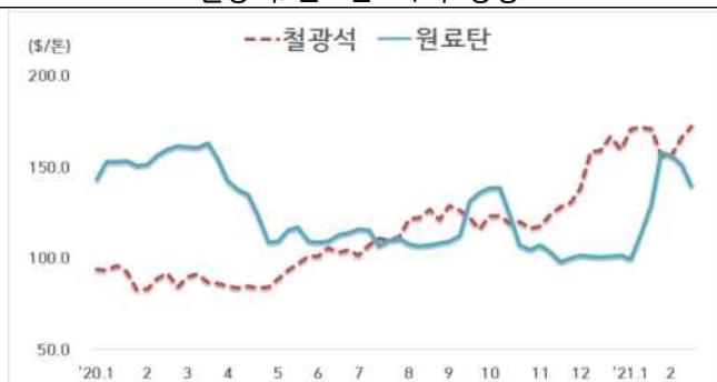
< 철광석/원료탄 가격 동향 >