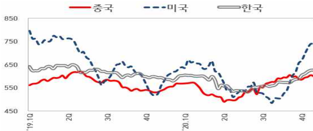
【국내의 열연강판 내수가격 동향】