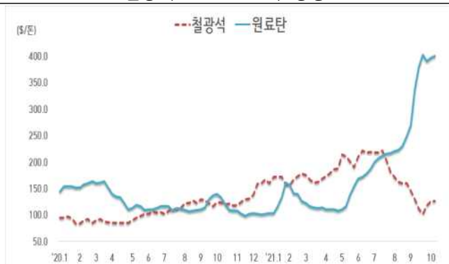
< 철광석/원료탄 가격 동향 >