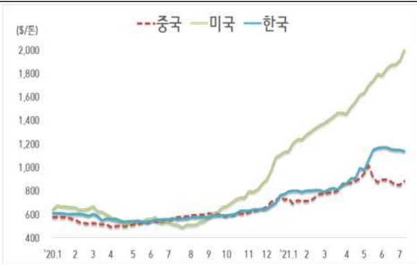
< 국내외 열연강판 내수가격 동향 >