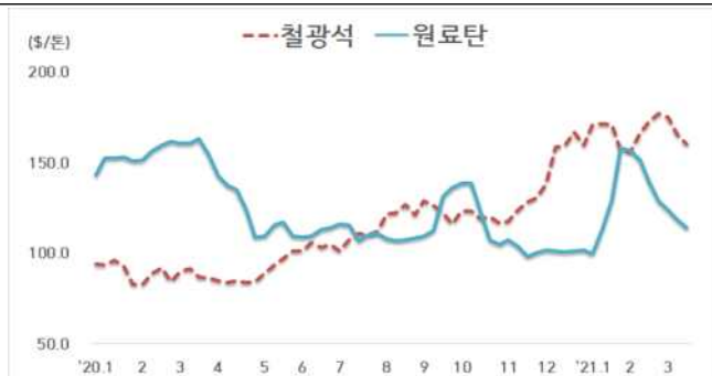
< 철광석/원료탄 가격 동향 >