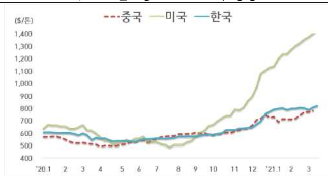
< 국내외 열연강판 내수가격 동향 >