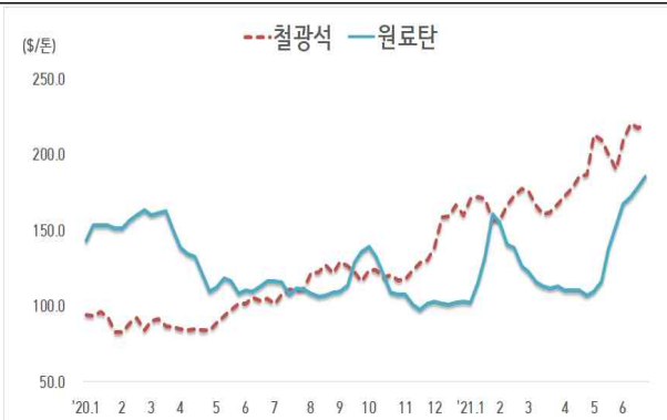
< 철광석/원료탄 가격 동향 >