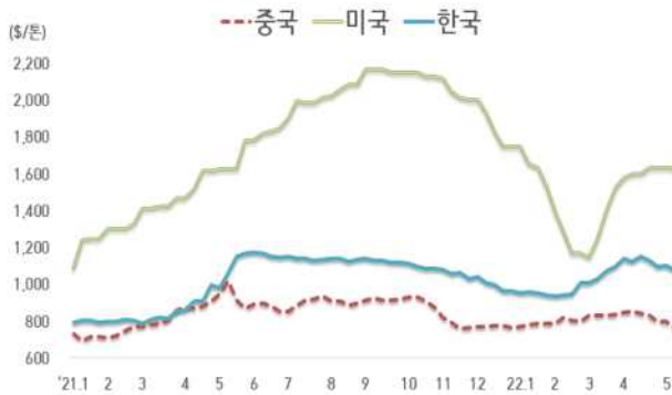
< 국내외 열연강판 내수가격 동향 >