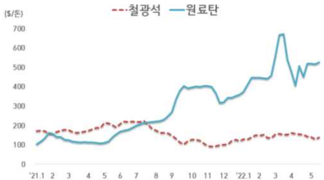
< 철광석/원료탄 가격 동향 >