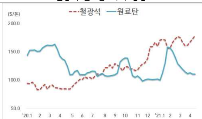
< 철광석/원료탄 가격 동향 >