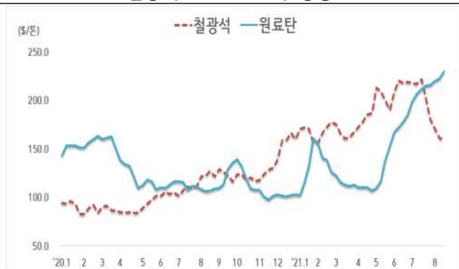
< 철광석/원료탄 가격 동향 >