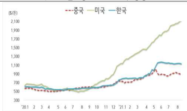
< 국내외 열연강판 내수가격 동향 >