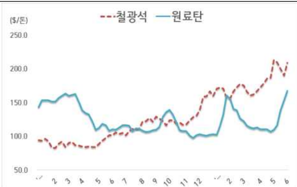
< 철광석/원료탄 가격 동향 >