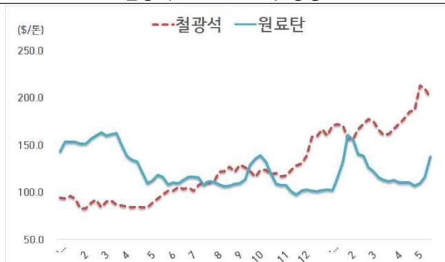
< 철광석/원료탄 가격 동향 >