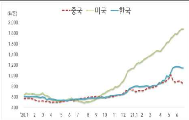
< 국내외 열연강판 내수가격 동향 >