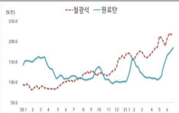
< 철광석/원료탄 가격 동향 >