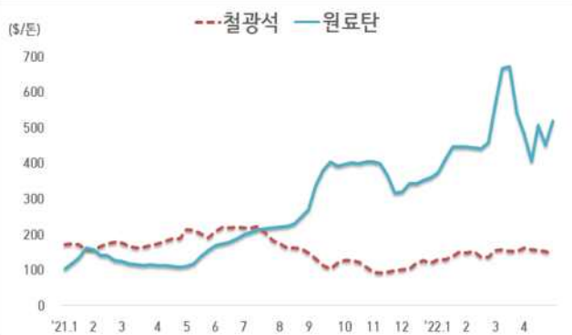
< 철광석/원료탄 가격 동향 >