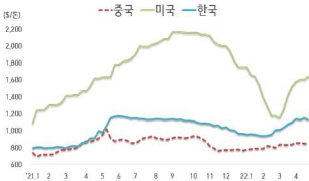
< 국내외 열연강판 내수가격 동향 >