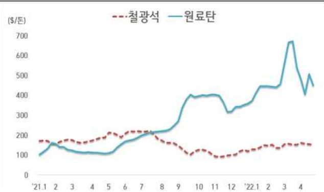
< 철광석/원료탄 가격 동향 >