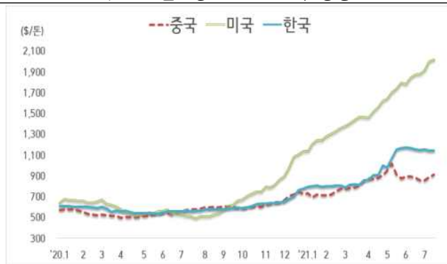
< 국내외 열연강판 내수가격 동향 >