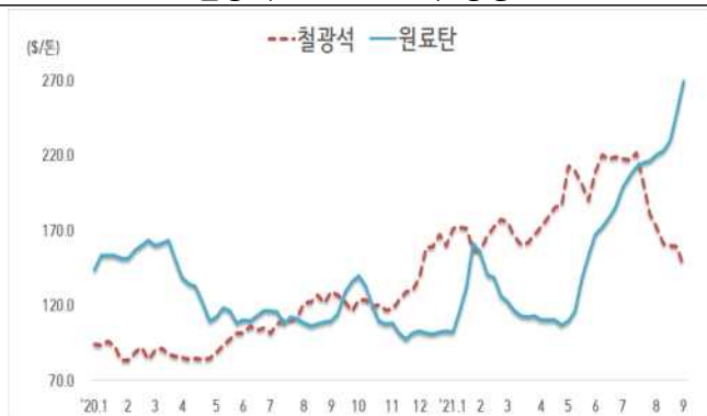
< 철광석/원료탄 가격 동향 >