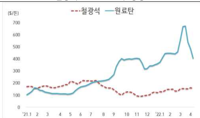
< 철광석/원료탄 가격 동향 >