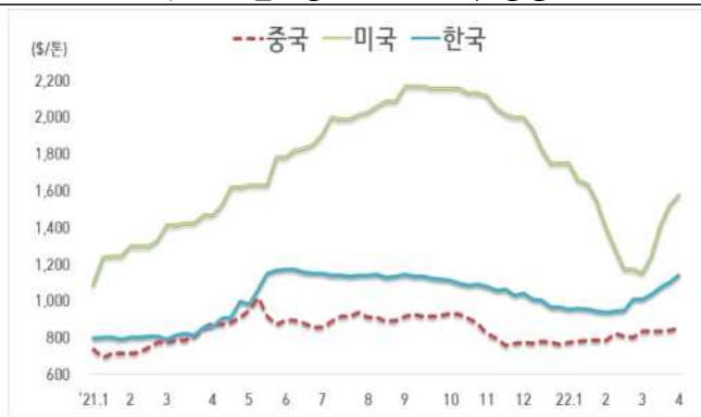
< 국내외 열연강판 내수가격 동향 >